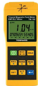
נתוני מכשיר TM 192:

מכשיר מדידה איזוטרופי מתוצרת חברת TENMARS טאיוואן מכשיר מדידה בעל רגישות גבוהה ויכולת למדוד את גודל וקטור השדה המגנטי וגם את גודל שלושת הרכיבים (X,Y,Z) של השדה המגנטי.