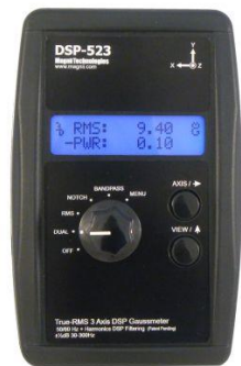
נתוני מכשיר DSP 523:

מכשיר מדידה מתוצרת חברת מגני טכנולוגיות Magnii Technologies ארצות הברית. מכשיר מדויק בעל רגישות גבוהה המשתמש במעבד אותות דיגיטלי חזק. מודד בשלושה צירים את גודל וקטור השדה המגנטי (True RMS). בעל יכולת להבדיל בין שדה מגנטי שמקורו מרשת החשמל (50 Hz והרמוניות שלו) לבין שדה מגנטי שמגיע ממקורות אחרים.